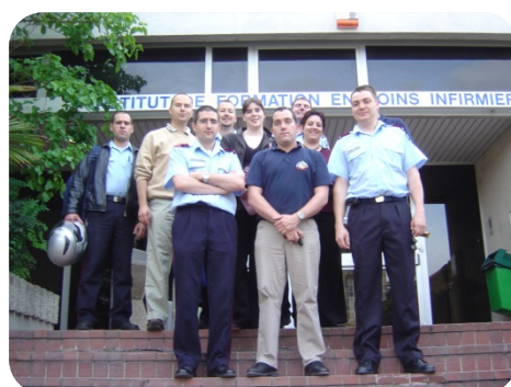
Equipe organisatrice des JNISP 2006