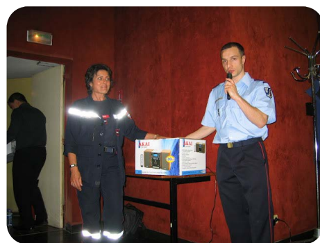
JNISP du 21 05 2005

Désormais dans un format trop petit, l'ANISP décide de lancer les JNISP sur deux jours et commence son tour de France pour aller à la rencontre des ISP. En 2007, la nouvelle aventure se pose à Clermont Ferrand...Une nouvelle ère est lancée