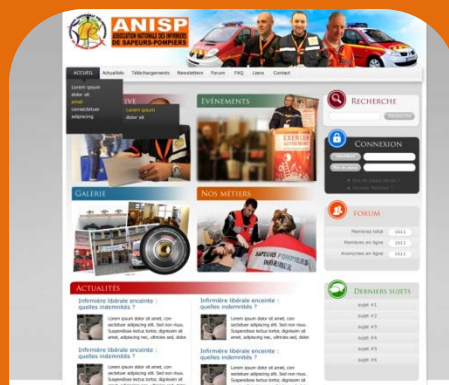
Nouveau site en 2012

Elles ont permis de parfaire les échanges avec un forum plus performant et de mieux communiquer