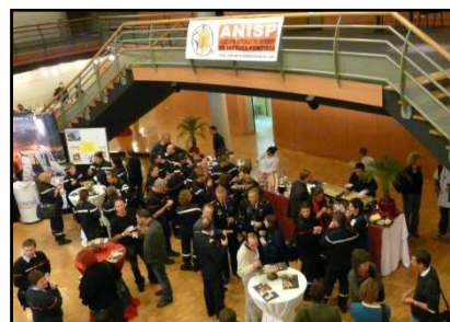
Des pauses riches en discussion et en rencontres

A la demande de certains de nos membres, une table ronde a été proposée pour leur permettre de s'exprimer librement autour des difficultés qu'ils rencontrent au quotidien dans leur SDIS.