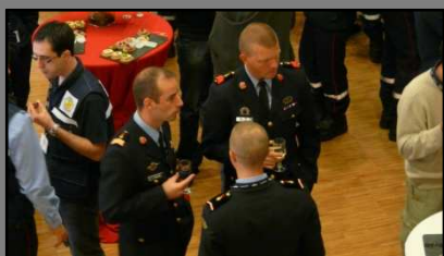
Des collègues de la BSPP, du BMPM et de Belgique nous ont fait le plaisir d'être à nos côtés

Cette écoute des difficultés mais surtout le partage des expériences et la rencontre d'infirmiers de toute la France (voir même de plus loin!!!) ont été à l'origine de la création de l'ANISP et demeure son objectif premier.